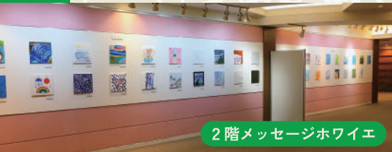
2階メッセージホワイトエ

(公財)アクロス福岡とFACT(福岡県障がい者文化芸術活動支援センター)の共同企画として福岡県内の障がいのある人たちの作品を紹介する企画展を開催します。3回目となる今回のテーマは「空飛ぶもの」。それぞれが自由にイメージした“空飛ぶ”作品が壁を彩ります。会期中は、ダンボールで鳥を作るワークショップやワークショップ作品の鳥が彩る会場での音楽とダンスのパフォーマンスを開催。アートグッズのセレクトショップもOPENします。アートを通してみんなで楽しみましょう！