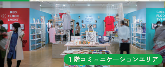
1階コミュニケーションエリア