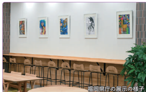
福岡県庁の展示の様子