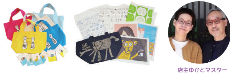
店主ゆかとマスター